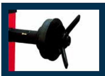
Serie coni con ghiera manuale Set of cones with standard locking handle Cônes avec écrou standard Konenset mit Standard-Spannflansch Juego de conos con brida rápida